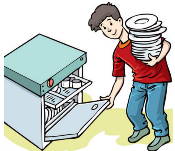
Spül-Maschine ein- und aus-räumen