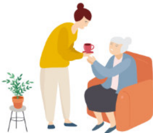
Unterstützung von Bewohner*innen