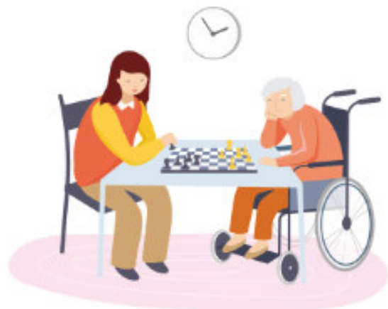
Beschäftigung mit Bewohner*innen